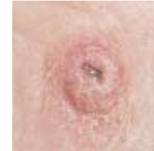
شکل ۲. شمایی از سرطان سلول‌های سنگفرشی (SCC)

سرطان سلول‌های سنگفرشی (شکل ۲) دومین شکل شایع سرطان پوست به شمار می‌رود که می‌تواند تمام بدن از جمله لایه‌های مخاطی را در بر گیرد. اکثر اشکال سرطان سلول‌های سنگفرشی مدت‌ها به لایه اپیدرم محدود می‌ماند و در صورت درمان نشدن به لایه‌های زیرین پوست راه یافته و بافت‌های دیگر را مورد تهاجم قرار می‌دهد. مواجهه‌ی مستمر اعضای بدن مانند صورت، گردن، اطراف گوش‌ها، پوست سر بدون پوشش مو، دست، شانه، پشت بدن و لب پایین دهان با پرتوهای فرابنفش از جمله علل ابتلا به این نوع سرطان است.