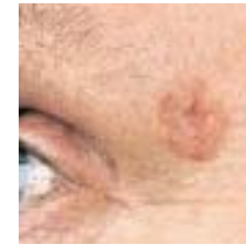
شکل ۱. شمایی از سرطان سلول‌های پایه (BCC)

سرطان سلول‌های سنگفرشی (شکل ۲) دومین شکل شایع سرطان پوست به شمار می‌رود که می‌تواند تمام بدن از جمله لایه‌های مخاطی را در بر گیرد. اکثر اشکال سرطان سلول‌های سنگفرشی مدت‌ها به لایه اپیدرم محدود می‌ماند و در صورت درمان نشدن به لایه‌های زیرین پوست راه یافته و بافت‌های دیگر را مورد تهاجم قرار می‌دهد. مواجهه‌ی مستمر اعضای بدن مانند صورت، گردن، اطراف گوش‌ها، پوست سر بدون پوشش مو، دست، شانه، پشت بدن و لب پایین دهان با پرتوهای فرابنفش از جمله علل ابتلا به این نوع سرطان است.